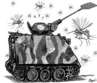
IQUE. Jornal do Brasil , 25 mar. 2008.

A charge a seguir trata da situação crítica a que está submetido o país em relação à dengue.