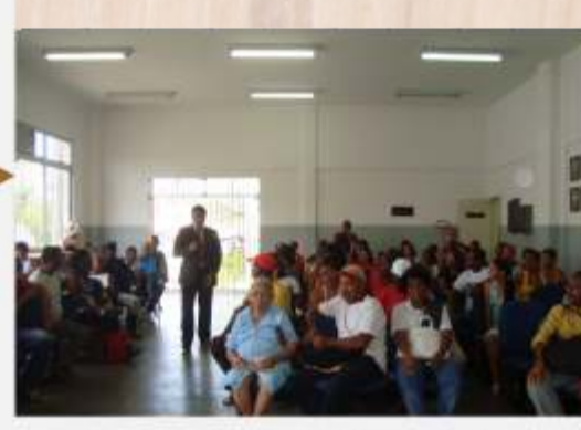
Ação Cidadã - Sou Pai Responsável Santo Amaro >> 11 a 13/08/10