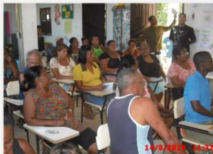
Defensoria participa da regularização fundiária em Paripe >> 14/08/10