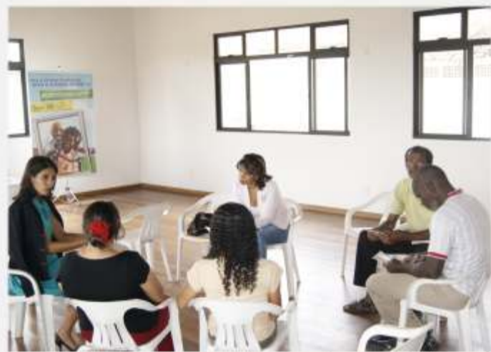
Apresentação Ação Cidadã - Sou Pai Responsável Castelo Branco >> 13/08/10