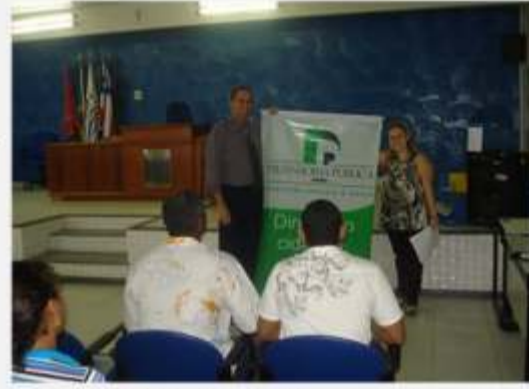
Ação Cidadã - Sou Pai Responsável Serrinha >> 11 a 13/08/10