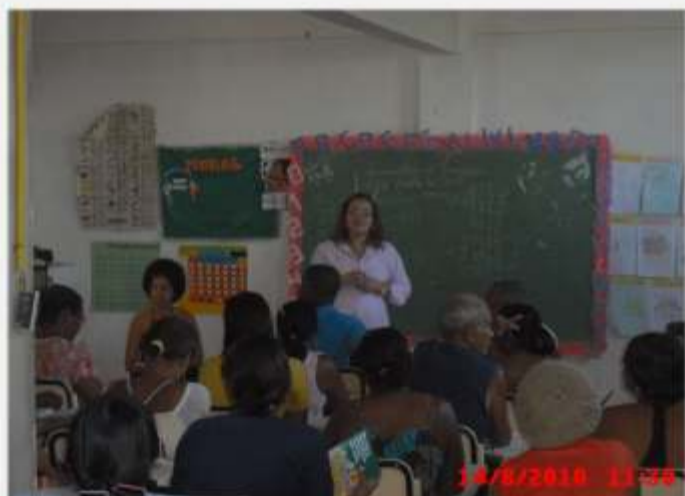
Defensoria participa da regularização fundiária em Paripe >> 14/08/10