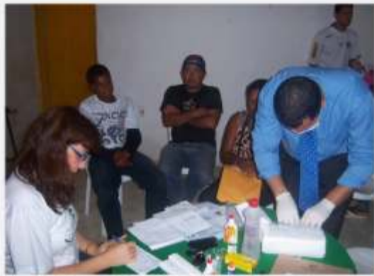
Ação Cidadã - Sou Pai Responsável Varzedo >> 11 a 13/08/10