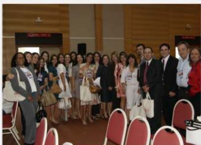
Defensoria no III Congresso Nordestino de Direito de Família >> 11 a 14/08/10