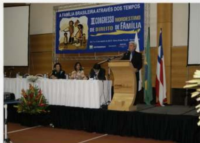
Defensoria no III Congresso Nordestino de Direito de Família >> 11 a 14/08/10