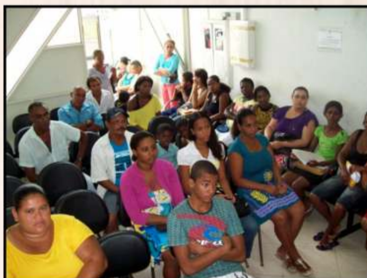
Ação Cidadã "Sou Pai Responsável" 26 a 28/08/10 Local: Salvador