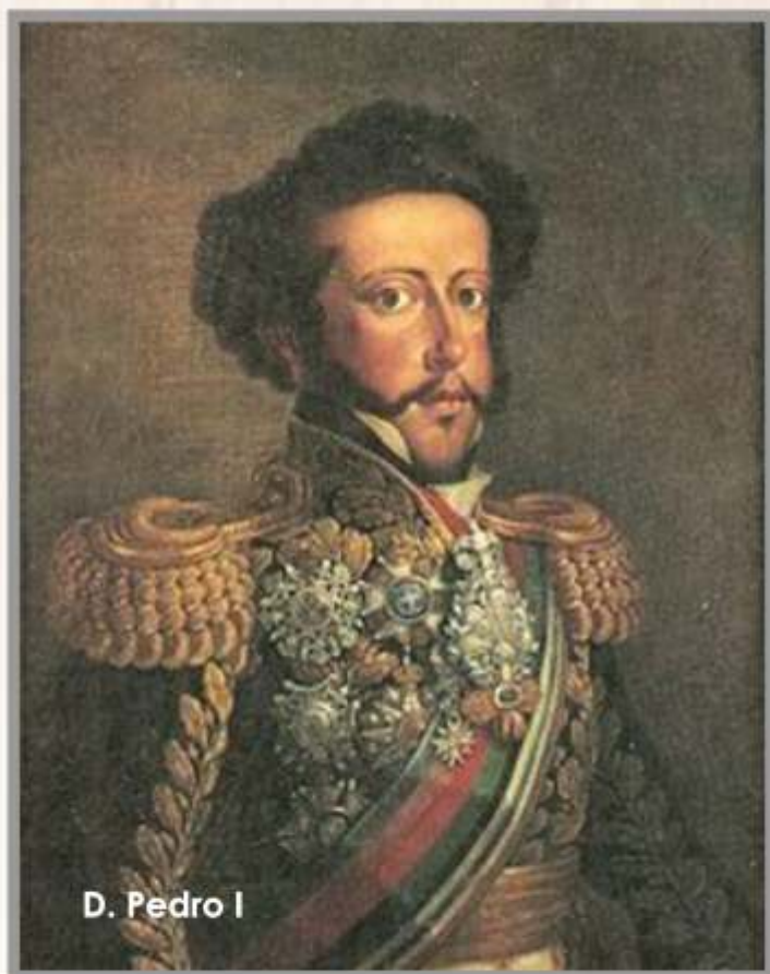
D. Pedro I

É o dia em que se comemora a Independência do Brasil, ou seja, a data em que o Brasil se tornou oficialmente separado politicamente de Portugal , no ano de 1822. As causas que implicaram na separação começaram a eclodir ainda no século XVIII, com diversas revoltas internas acontecendo por conta de impostos cobrados por Portugal além do fato de que no Norte, os EUA já se declaravam independentes.