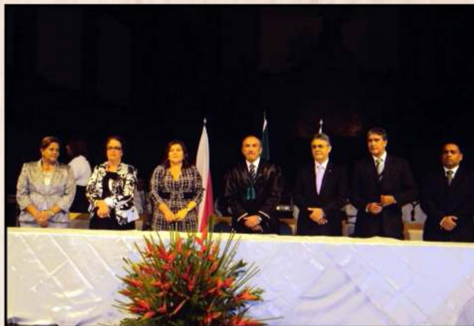
Ação Cidadã "Sou Pai Responsável" - 16 a 20/08/10 Local: Ilhéus