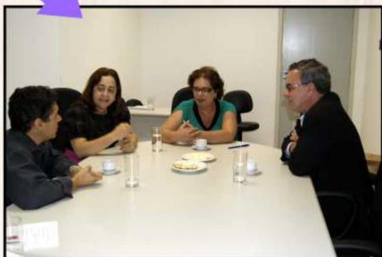
Planejamento Estratégico chega ao interior - 23 e 24/08/10 Local: Feira de Santana